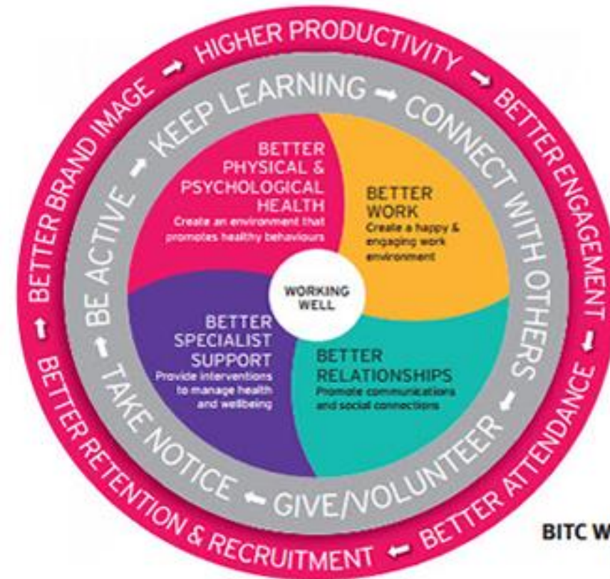
The BITC Workwell Model