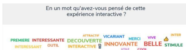
Capture d'écran 1 : Nuage de mots à l'issue de la présentation

L'évaluation par les participants de la pause pédagogique met en avant un vécu positif de l'utilisation de WOOCCLAP (capture d'écran 1). Ils estiment que la méthode de présentation est à reconduire et qu'elle facilite la mémorisation des apports (capture d'écran 2).